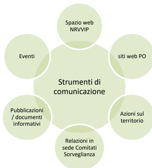
Figura 2. Gli strumenti della comunicazione proposti nel DUV

Pertanto nell'ambito della comunicazione una quota parte di attività sarà indirizzata al trasferimento di metodologie e pratiche funzionali a sviluppare un patrimonio comune di conoscenze presso gli attori ed i territori coinvolti nei processi implementativi del PSR. Tale azione potrà essere condotta attraverso: